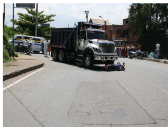
Fotografía 12. Posición final de los vehículos, se evidencia distancia entre el eje delantero derecho de la volqueta con respecto al andén. cuerpo de la víctima debajo de la volqueta.