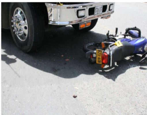
Fotografía 15. Plano lado derecho del accidente, se evidencia posición final de los vehículos, moto caída a su lado derecho, direccional delantera izquierda de la volqueta doblada, material biológico lado derecho de la volqueta.