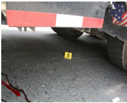
Fotografía 24. Lado izquierdo de la volqueta, se evidencia huella de arrastre metálico debajo de la volqueta desde la carrera 94 bajando, y fluidos.