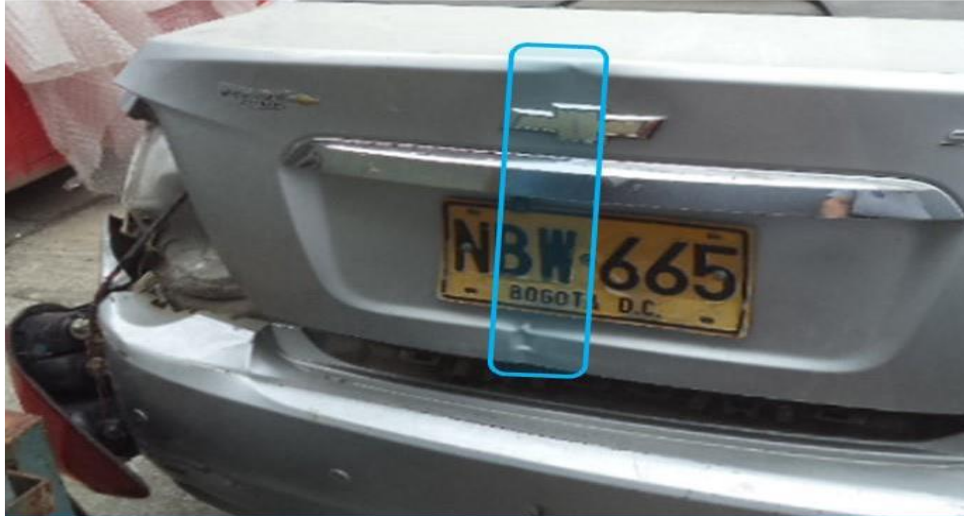
Posible orientación de elemento fijo contra el que se da el impacto